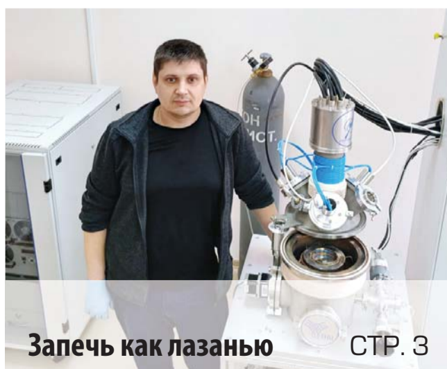
Запечь как лазанью