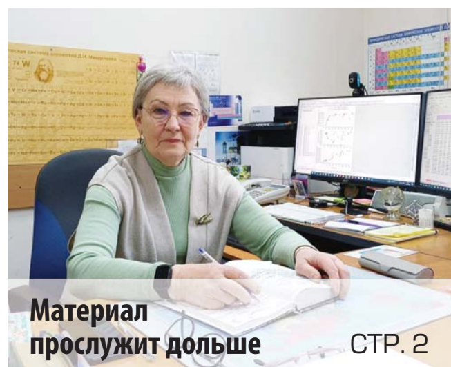
Материал прослужит дольше

Реализация этой идеи потребовала десятилетий сложнейших исследований. Одной из первых в нашей стране этой темой начала заниматься лаборатория В.П. Лукина. Сегодня здесь созданы уникальную элементную базу: измерители и датчики волнового фронта, системы управления. В тесном сотрудничестве с коллегами