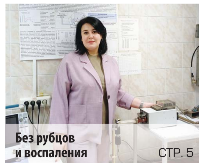
Без рубцов и воспаления